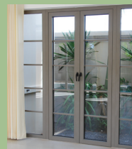
บานเปิดอลูมิเนียม CASEMENT WINDOWS & DOORS