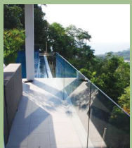
ราวกันตก GUARDRAIL