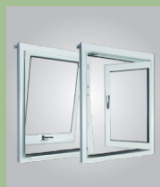
TILT & TURN SYSTEM