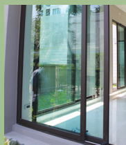
บานเลื่อนอลูมิเนียม SLIDING WINDOWS & DOORS