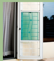
VERTICAL SLIDING SYSTEM