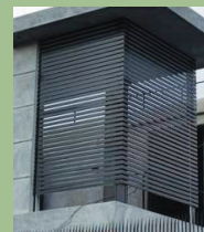
รั้วตกแต่ง DECORATE FENCE