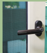
มุ้งลวดกันขโมย SECURITY MESH