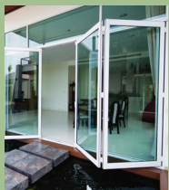
บานเพิ่มอลูมิเนียม FOLDING WINDOWS & DOORS