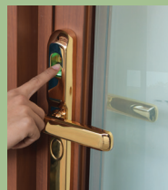
INTELLIGENT SYSTEM WINDOWS & DOORS